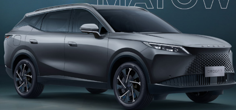
MATTE GRAY (UK)