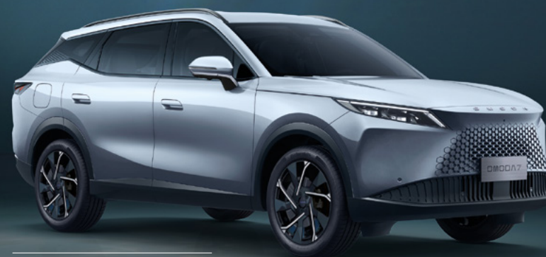
MOONLIGHT SILVER (KU)