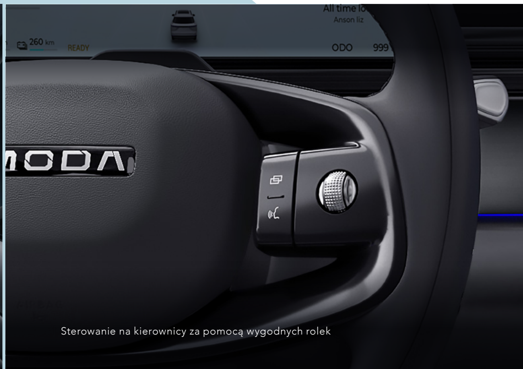
Sterowanie na kierownicy za pomocą wygodnych rolek