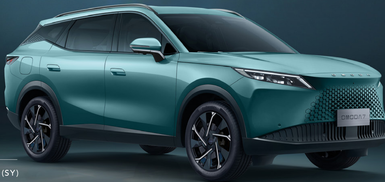
MIST GREEN (SY)