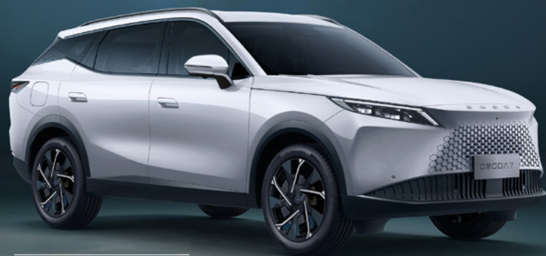
KHAKI WHITE (BW)