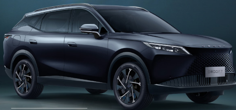
CARBON BLACK (CL)