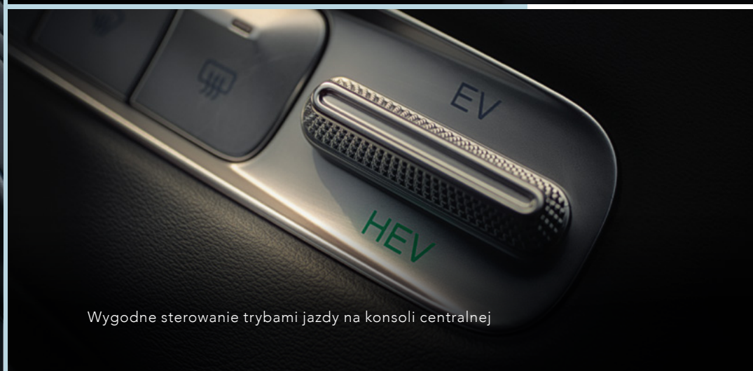
Wygodne sterowanie trybami jazdy na konsoli centralnej